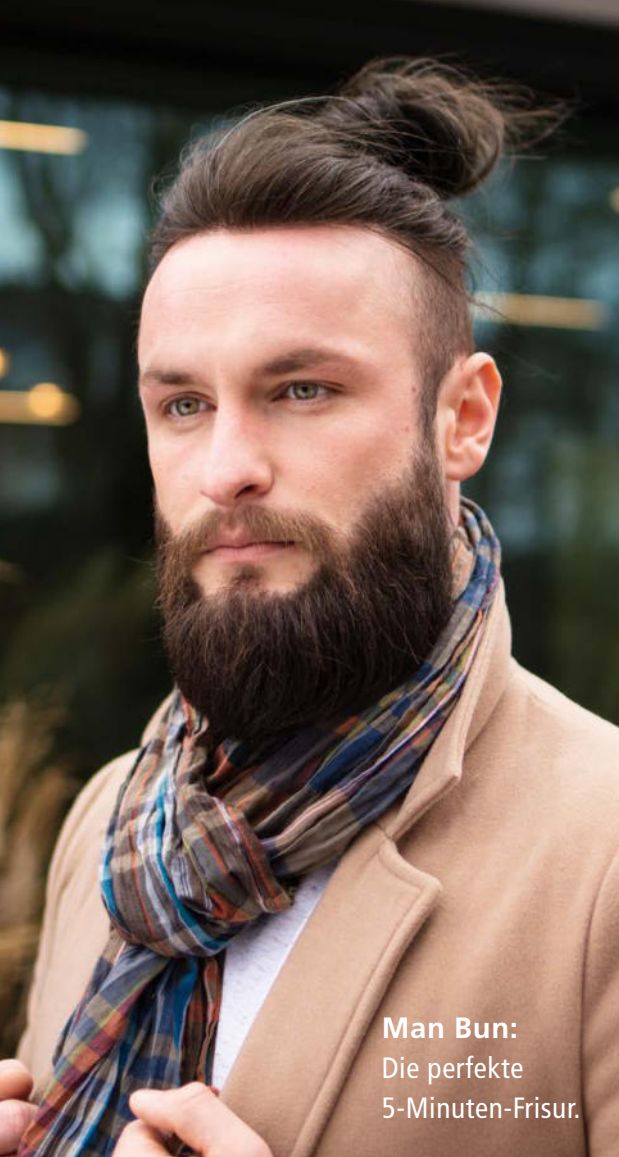
Man Bun: Die perfekte 5-Minuten-Frisur.